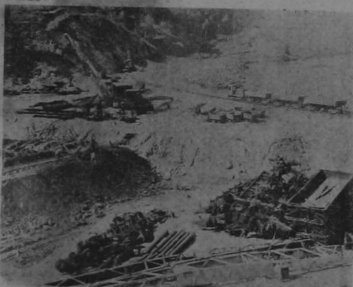
Valioso e importante relleno del nuevo puerto de Quepos.